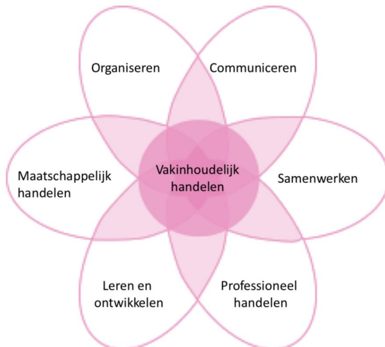
Figuur 1 De zeven competentiegebieden voor de SOH

We hebben het competentieprofiel voor de SOH uitgewerkt op basis van het CanMEDS-model. Hierbij zijn we ervan uitgegaan dat de SOH al beschikt over alle competenties voor doktersassistenten. Voor meer informatie hierover zie het Beroepscompetentieprofiel doktersassistent van de NVDA.